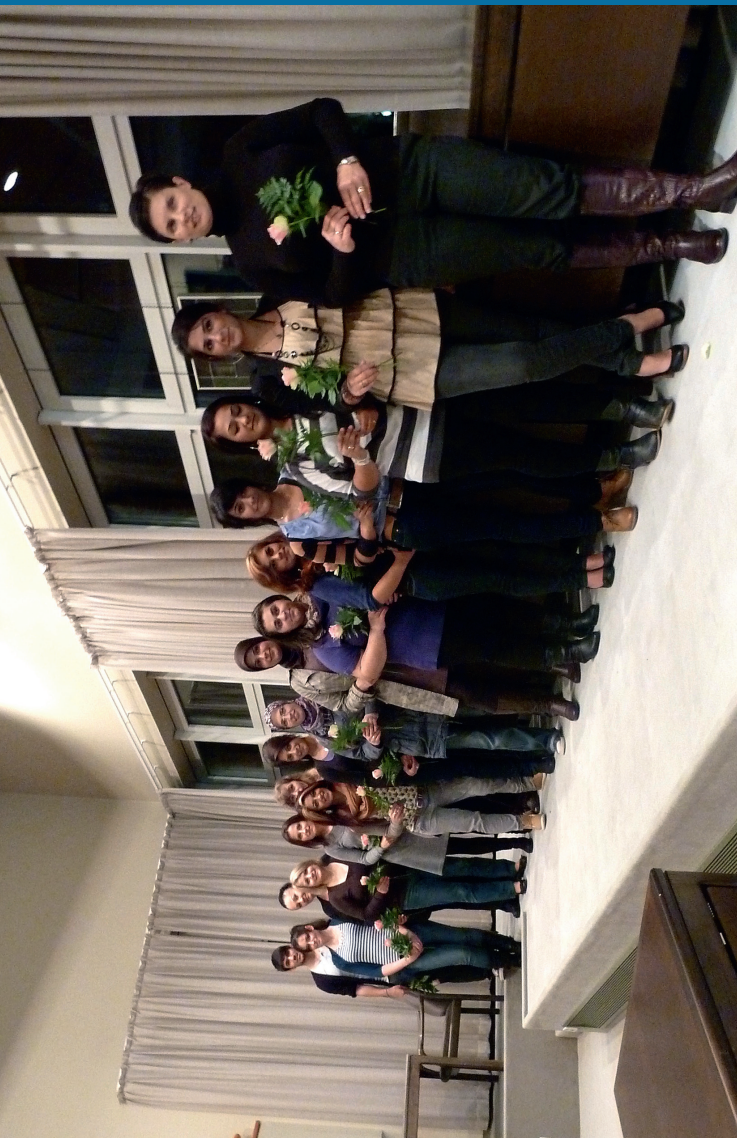
MiMi-MediatorInnen Landkreis Cuxhaven