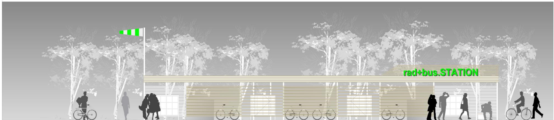
SÜDANSICHT M 1:10