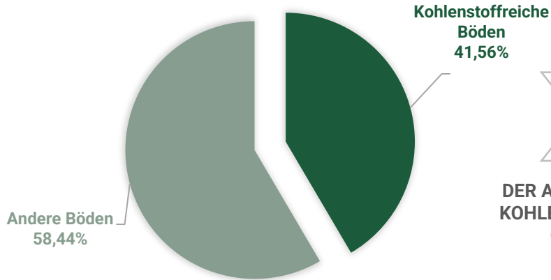
ANTEIL DER KOHLENSTOFFFREICHEN BÖDEN AN DER GESAMTFLÄCHE DER SG LAND HADELN