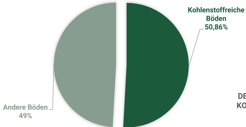
ANTEIL DER KOHLENSTOFFFREICHEN BÖDEN AN DER GESAMTFLÄCHE DER EG SCHIFFDORF